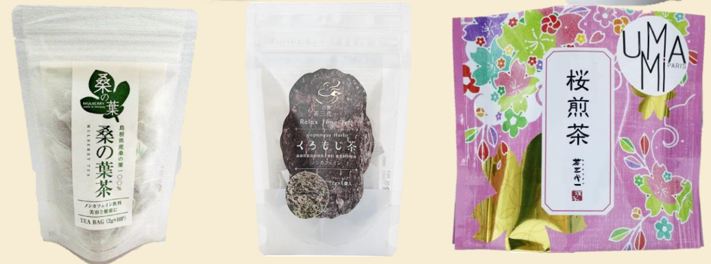
番茶、煎茶、ほうじ茶、玄米茶、玉露