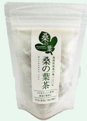
桑の葉茶ティーバック