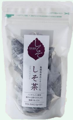
しそ茶ティーバック