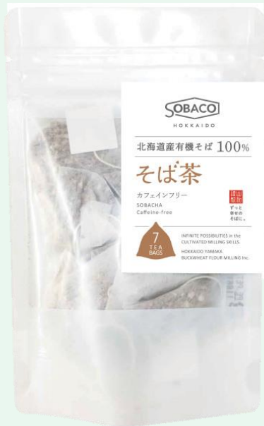
そば茶ティーバッグ