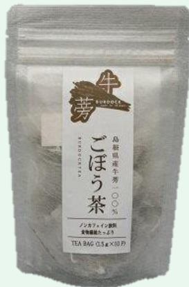
ごぼう茶 ティーバック